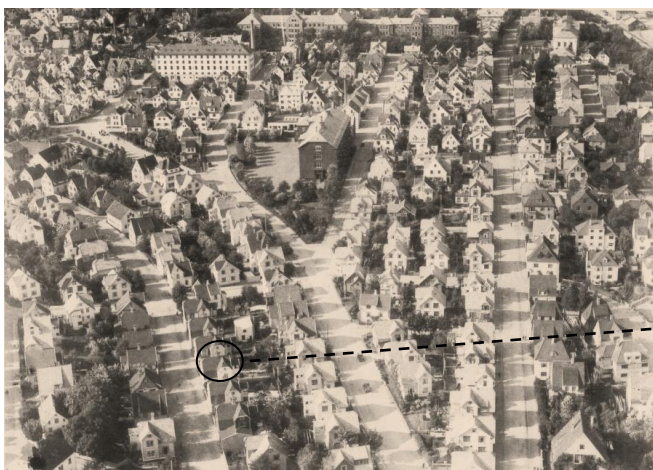
Fra Våland på 1930 -tallet