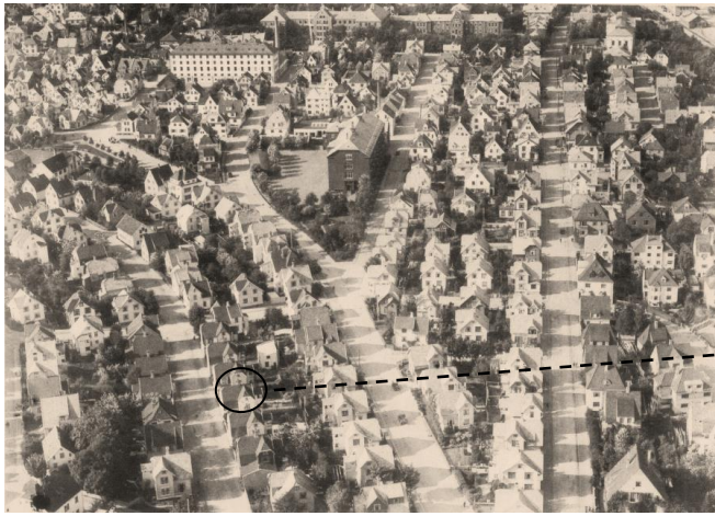
Fra Våland på 1930 -tallet