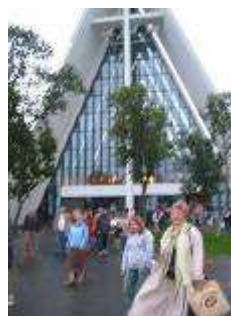
Midnattskonsert i Ishavskatedrale

Neste kveld er vi i Tromsø igjen. Da bærer det avsted på midnattskonsert i Ishavskatedralen. Fantastisk. Konserten var ferdig kl 01.30 og vi kom ut i fullt dagslys. (..... selv om solen var gjemt bakom skyene.)