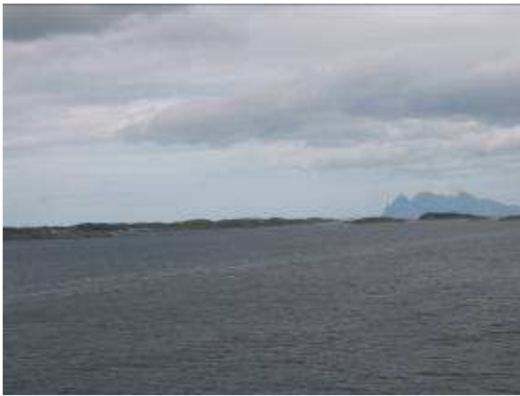
Sør-Arnøy med Landego i bakgrunnen