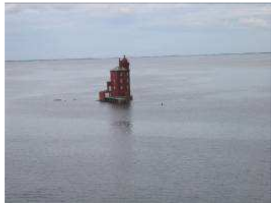
Kjeungskjæret fyr. Var det noen som sa sterk kuling på Trøndelagskysten?

Turen med "M/S Finnmarken" startet onsdag 12. juli kl 12. Været i Trondheim var bra, men meteorologen meldte sterk kuling på Trøndelagskysten. Vi lurte nok litt på hvordan den skulle bli over Folda. Vi vart ikkje skræmt. Sannsynligvis kom vinden aldri opp i 20 sekundmeter slik værvarsleren sa, men også båtstørrelse og konstruksjon betyr noe under slike omstendigheter. De nye hurtigruteskipene synes solide for denne type forhold.