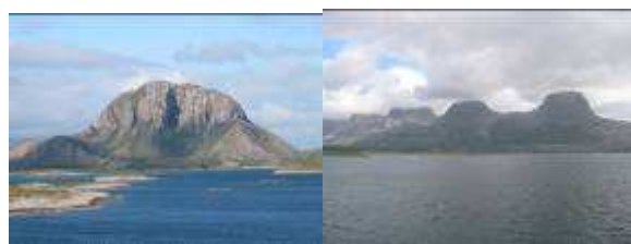
Torghatten og De sju søstre