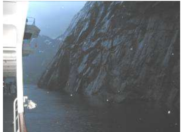
Trollfjorden - en våt sak....

Trollfjorden ble en våt sak. Det var usikkert om kapteinen vill gå inn. Her er smalt og vinden ville være avgjørende. Åpningen inn til den trange fjorden er smal. Og "Finnmarken" er det desidert største av hurtigruteskipene. Men inn kom vi. Det ble servert Trollfjordsuppe på soldekket, selv om solen var fraværende.