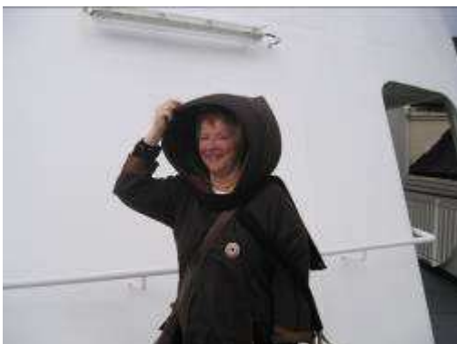
Litt windy i Stamsund

Værmeldingen fra Trøndelagskysten fulgte oss nordover. Meldingen tilsa liten storm i ytre Lofoten. Og vi skulle over Vestfjorden til Stamsund!! Men også det gikk tålig. Litt windy var det utpå der, men igjen vindretning og en god sjøbåt tok luven av meteorologen. Middagsmåltidet som ble servert på vei fra Stamsund til Svolvær led ingen nød på grunn av rufsete vær og sjø.