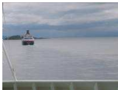
Nordgående "M/S Polarlys" ut fra Harstad

Dagen etter forlater vi Harstad om morgenen, og turen gjennom Vesterålen er flott. Spesielt passeringen av Risøyrenna, en 'hand made' eller rettere 'man made' kanal som er nødvendig for at større skip skal kunne passere mellom Hinnøya og øyene i Vesterålen. Stedene Risøyhamn, Sortland og Stokmarknes anløpes. (Det hadde holdt med et anløp her, og da er vel Stokmarknes det mest interessante). Senere på dagen er det nok et besøk i Trollfjorden før vi om kvelden igjen er i Svolvær og senere Stamsund.