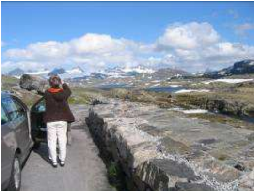
Fra Sognefjell, utsikt mot Jotunheimen