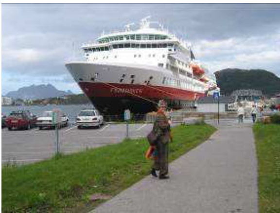
"M/S Finnmarken" ved kai i Bodø

Værmeldingen fra Trøndelagskysten fulgte oss nordover. Meldingen tilsa liten storm i ytre Lofoten. Og vi skulle over Vestfjorden til Stamsund!! Men også det gikk tålig. Litt windy var det utpå der, men igjen vindretning og en god sjøbåt tok luven av meteorologen. Middagsmåltidet som ble servert på vei fra Stamsund til Svolvær led ingen nød på grunn av rufsete vær og sjø.