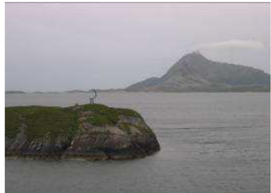
'Polarsirkelen' med Hestmona i bakgrunnen.