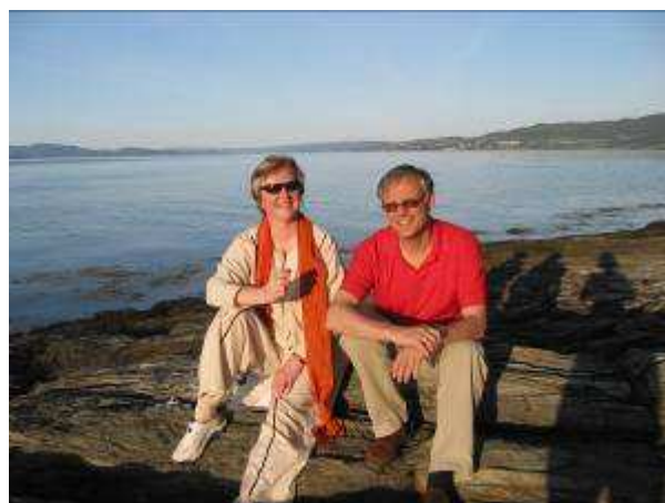
Idyll ved Trondheimsfjorden.....

Vi var i Trondheim et par dager før vi dro hjem over Valdresflya og Hardangervidda.