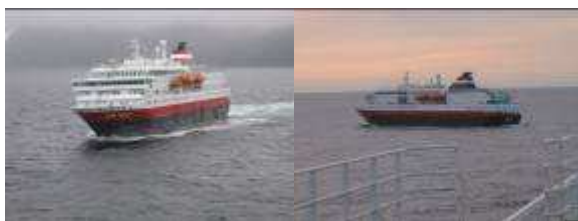
Møtende "M/S Kong Harald" og "M/S Nordlys"

slike møter. Ved Havøysund traff vi "Kong Harald" om morgenen den 15. juli, og i Berlevåg "Nordlys" samme kveld. (Det blir litt 'problematisk' for enkelte at vi treffer to pr døgn når det bare går en nordover hvert døgn. Det blir alltid litt diskusjon om det.) Dagens begivenhet var turen til Nordkapp. Vi har vært der før, og vet hvordan det kan se ut. Været i Honningsvåg var brukbart, men på Nordkapp var det tåke, tett tåke. Så utsikten fikk vi gjenkalle fra 'minnenes memory'. Tilbake i Honningsvåg skinte solen. Den skinte også på Finnkjerka da vi kom til Kjøllefjord denne kvelden.