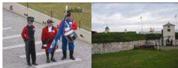
Vardøhus festning m/ følge

Det gjorde den, solen altså, også i Kirkenes neste dag. Vi valgte en rusletur i byen. Øst-Finnmark er et goldt og grått landskap med mye trist bebyggelse. Selv om vi i Kirkenes ser noe grønt i omgivelsene. Vardø spesielt er en grå by med bare sånn passelig velholdte eiendommer. At arbeidsledigheten her er stor, og sikkert dermed også tiltakslysten liten, er godt synlig. Utkantnorge nyter tydelig ikke godt av at vi er i et av verdens rikeste land. Vardøhus festning er imidlertid et besøk verd. Guiden møter deg på kaien.